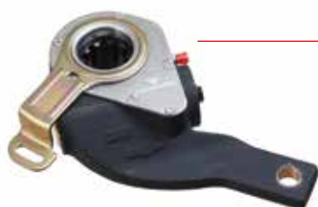
AJUSTADOR AUTOMÁTICO DE FREIO, SCANIA K/L 113 CL/LL/TL 93< 2º EIXO LE