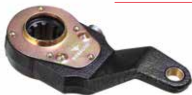
AJUSTADOR MANUAL DE FREIO, DIANTEIRA, SCANIA 112/113 LD - (10 ESTRIAS) 14MM