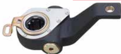
AJUSTADOR MANUAL DE FREIO, DIANTEIRA, SCANIA 112/113 LD - (10 ESTRIAS) 14MM